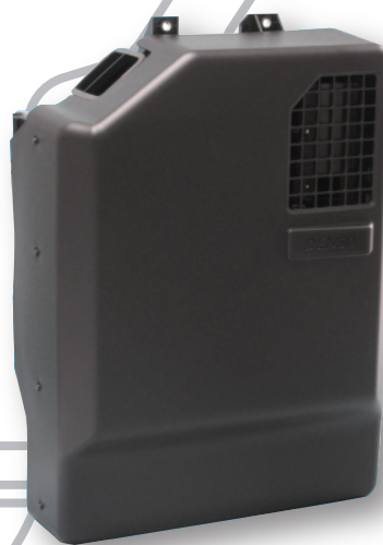
CAM COOL キャンピングカー用クーラ